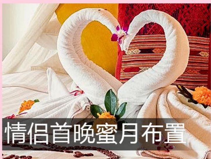
情侣首晚蜜月布置