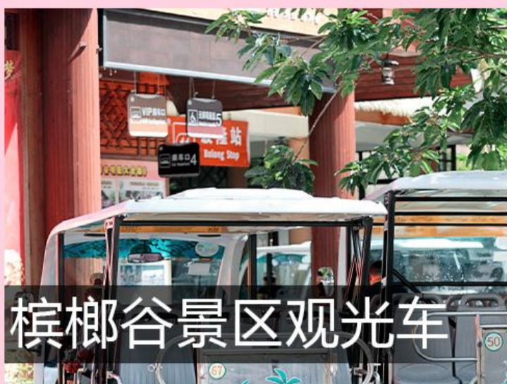
槟榔谷景区观光车