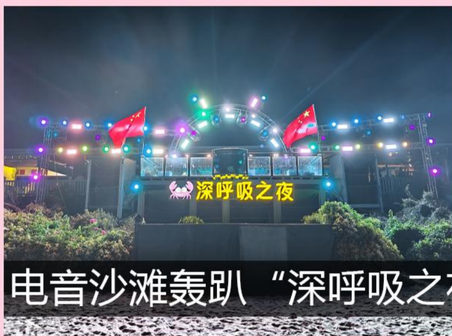
电音沙滩轰趴“深呼吸之夜”